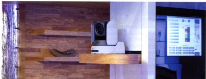
Eine der HD-Kameras zur Aufzeichnung der Kochkurse

Der Architekt und Designer Jörg Gehles schuf eine Umgebung, die die Kreativität der Koch-