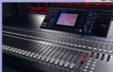
Beschallung Comedia Theater