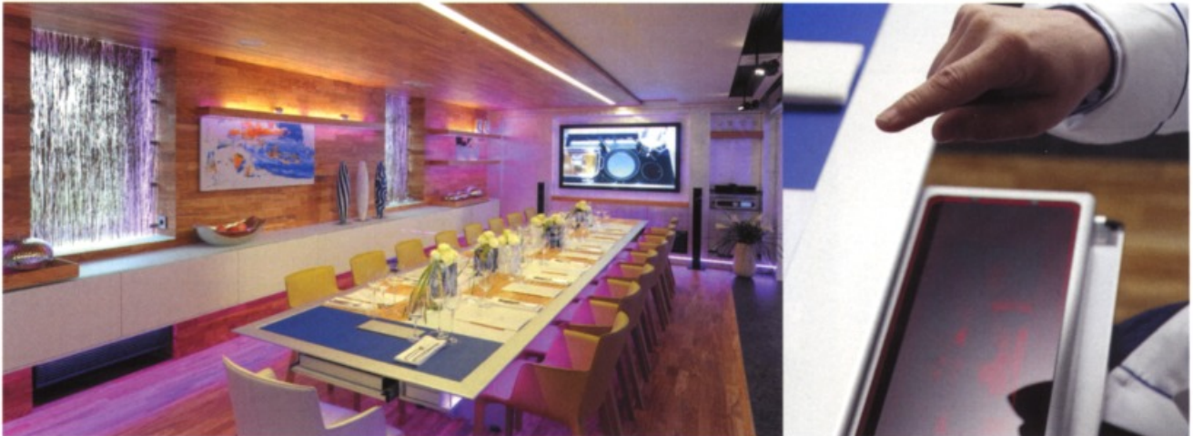
Keine Technik auf dem Speisetisch – hier werden die Medien- und Raumfunktionen über die Gestensteuerung bedient.

aus Limburgerhof bei Ludwigsheim ( www.ci-bek.de ) verantwortlich. Das Unternehmen hat bereits Lafers Privatküche als interaktive Küche umgebaut. Gesteuert werden sowohl Raumfunktionen wie Licht und Klima sowie die oben erwähnte Medientechnik. Ebenfalls integriert ist die Abfrage der Betriebsdaten der Miele-Küchengeräte, die die Anzeige der Backofentemperatur oder die aktuelle Temperatur eines Wasserbades erlaubt.