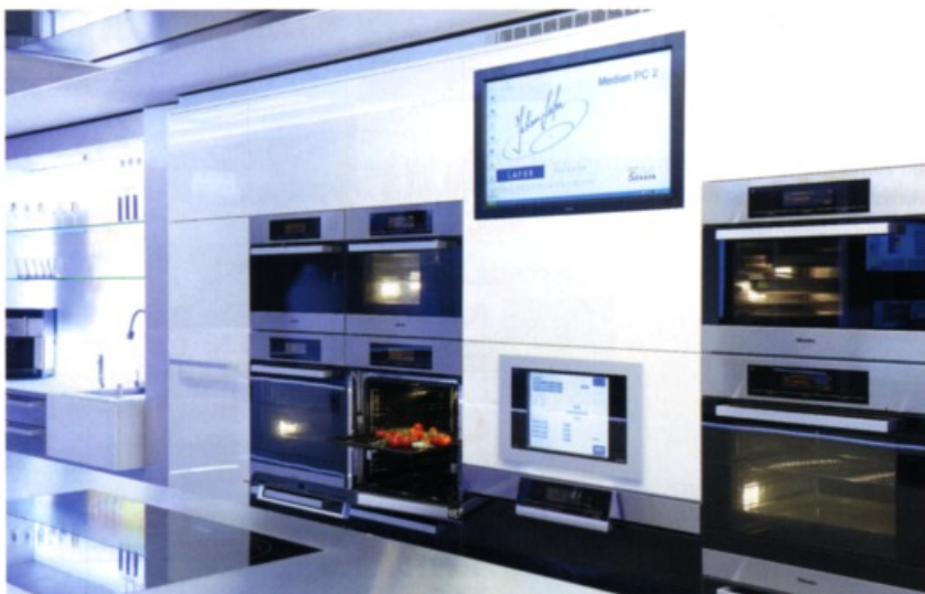
Ebenfalls integriert ist die Abfrage der Betriebsdaten der Miele-Küchengeräte, die die Anzeige der Backofentemperatur oder die aktuelle Temperatur eines Wasserbades erlaubt.

Die Bild- und Audioregie sowie das Web-Streaming laufen über das mobile Produktionssystem Sony Anycast Station. Die Aufnahme erfolgt von der Begrüßung bis zum Dessert über einen Sony HD SxS Card Recorder mit zwei Steckplätzen für bis zu 180 Minuten unterbrechungsfreier Aufzeichnung. Am Regieplatz im oberen Stockwerk befindet sich neben dem AV-Mischer auch ein non-lineares Vegas HD-Schnittsystem von Sony für den Schnitt sowie die Erstellung von Blu-ray-Disks oder DVDs, die noch während des Kochkurses erstellt werden.