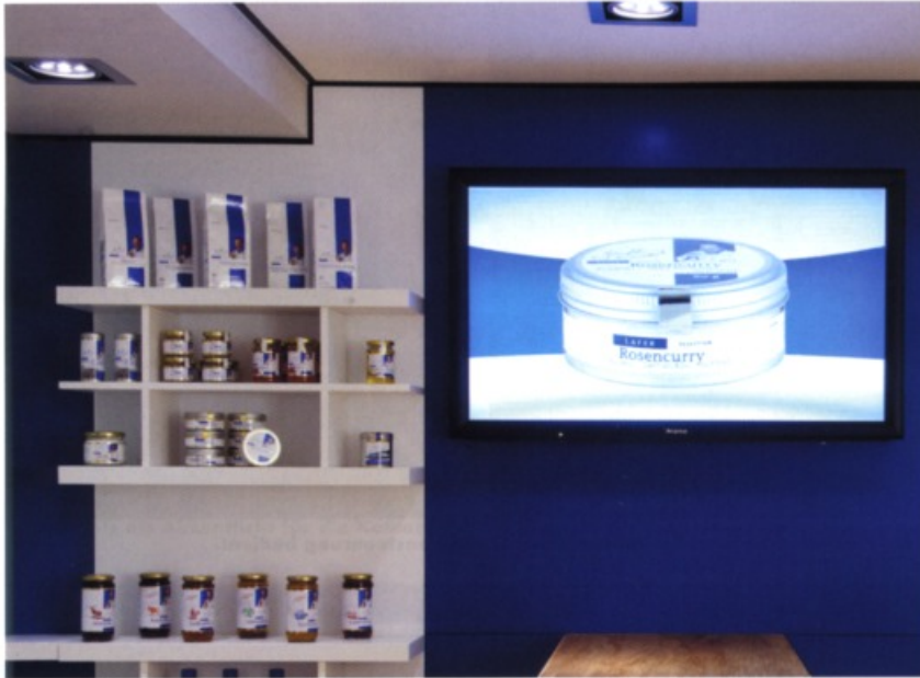
Medienwand im Shop

blade für sämtliche Steuerfunktionen zur Verfügung. Dieses Wireless-Touchpanel erlaubt als Besonderheit auch die Steuerung über Sprache.