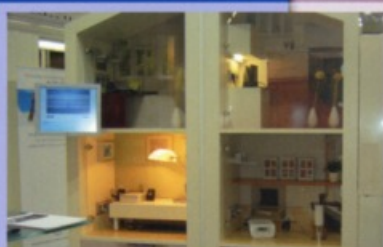
Residential Smart Grids auf der Elektrotechnik 2009