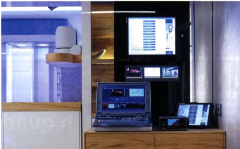
Geballte Medientechnik: Links auf dem Board das Produktionssystem Sony Anycast Station, mittig als Wandeinbau eines der Bedien-Touchpanels, rechts auf dem Board das mobile Bedienpanel mit Sprachsteuerung