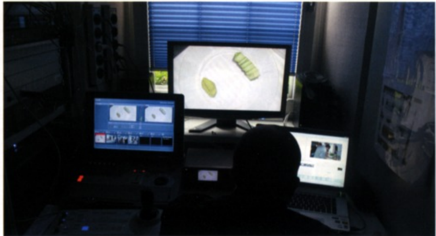
Regieplatz für die Live-Aufzeichnung im oberen Stockwerk